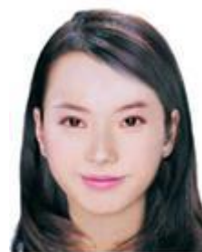
貼 相 片